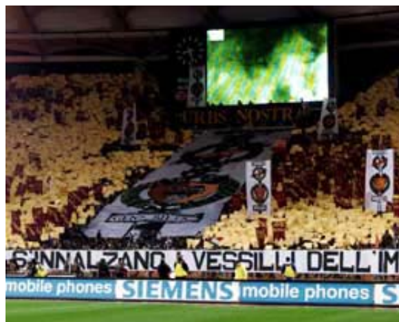
I tifosi dell'Ataturk festeggiano la Fantavittoria ad Istanbul.

LE POLEMICHE DELLA AS PAPEROPOLI CHE ROSICA